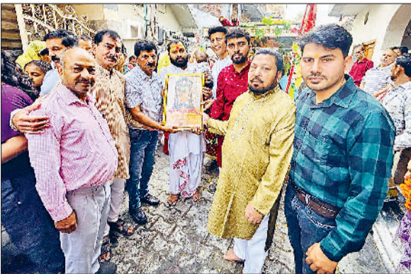
यमुनानगर। आचार्य की स्मृति किन्हे देकर सम्मानित करते दत्ता परिवार के सदस्य।

श्री हनुमान मंदिर रामपुरा कॉलोनी में दो अप्रैल को भगवान हनुमान जी का जन्मोत्सव बड़ी धूमधाम के साथ मनाया जाएगा। समागम का निमंत्रण आम जनमानस को देने की लेकर मंदिर द्वारा शहर में प्रभात फेरियों का आयोजन किया जा रहा है। प्रभात फेरी में दिन प्रतिदिन श्रद्धालुओं की संख्या बढ़