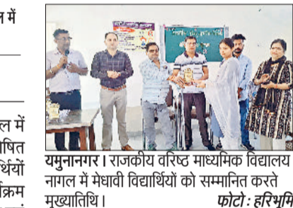
यमुनानगर। राजकीय वरिष्ठ माध्यमिक विद्यालय नागल में मेधावी विद्यार्थियों को सम्मानित करते मुख्यातिथि।