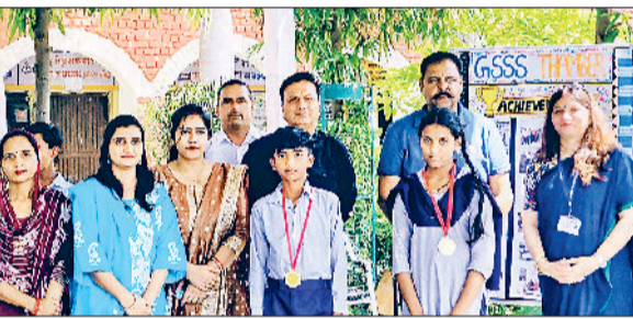
बराड़ा। कार्यक्रम के दौरान उपस्थित स्टाफ।