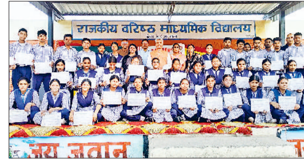
जिला शिक्षा अधिकारी युवा संसद कार्यक्रम में भाग लेने वाले बच्चों को सम्मानित करते।