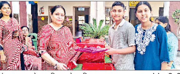
अंबाला। छात्र को सम्मानित करते हुए शिक्षक।